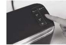
(Fig. 7) Vypínání stroje - Stiskněte tlačítko On/Off a vypněte hlavní vypínač