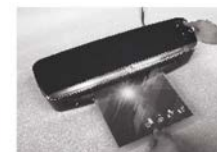
V případě zaseknutí kapsy stiskněte REV. tlačítko a uslyšíte pípnutí. Vytáhněte zaseknutou laminaci ze vstupu sáčku.