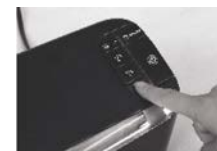
(Fig. 2) Stiskněte tlačítko, odpovídající použitému sáčku. Pro laminaci za studena, stiskněte tlačítko Studená.