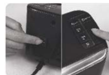
(Fig. 1) Zapněte hlavní vypínač a stiskněte tlačítko On/Off.