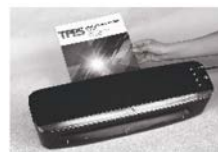
(Fig. 5) Vyměňte hotovou laminaci z výstupního zásobníku na zadní straně zařízení.