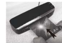
(Fig. 4) Vložte kapsu (správný dokument uvnitř) do vstupu sáčku zataveným okrajem napřed.