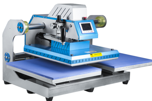
manuálně posuvná topná deska