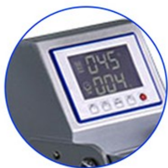
Přehledný digitální displej

Dvě pracovní desky pro zvýšení produktivity. Díky přesnému nastavení tlaku, teploty a času minimalizujete možnost chyb při přenosu. Nový mikroprocesor pro řízení teploty pracující s přesností 0,5 °C. Topná deska a tepelná spirála jsou v jednom bloku. Jednoduchý systém pro výměnu pracovních desek různých velikostí.